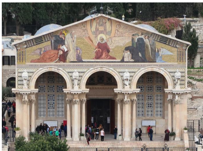
Kirche der Nationen, Jerusalem