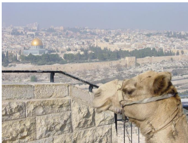
Jerusalem, Blick vom Ölberg

von Freitag, 25.02.2022 bis Sonntag, 06.03.2022