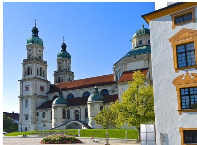
Basilika St. Lorenz, Kempten

Tarifstand: 21. Januar 2021. Tarifänderungen sowie eine Mindestteilnehmeranzahl von 20 Personen bleiben vorbehalten.