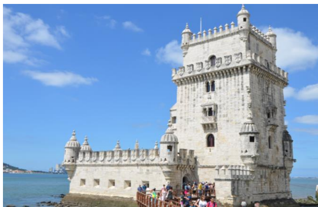
Torre de Belém, Lissabon

von Samstag, 25.09.2021 bis Samstag, 02.10.2021