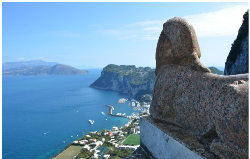
Villa San Michele, Capri

Blass Travel GmbH Erzbergerstr. 5 78224 Singen Tel.: 07731-87500 Fax: 07731-63422 info@blasstravel.com www.studienreise.org