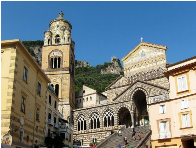
Dom von Amalfi

vom 4. Oktober 2021 bis 11. Oktober 2021