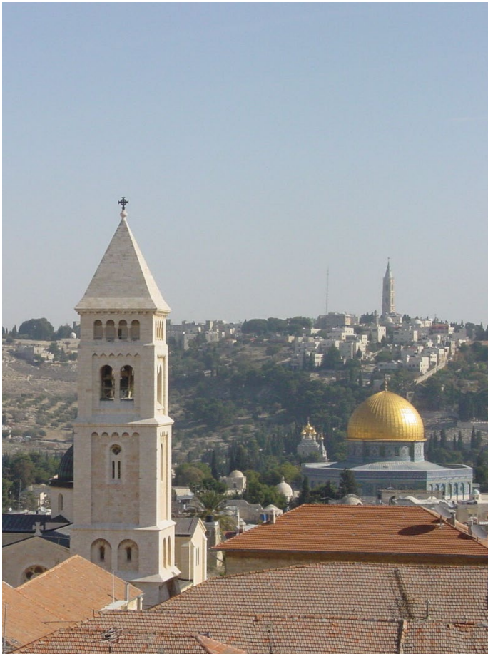
Blick auf die Erlöserkirche, Felsendom und Ölberg

von Donnerstag, 17.03.2022 bis Sonntag, 27.03.2022