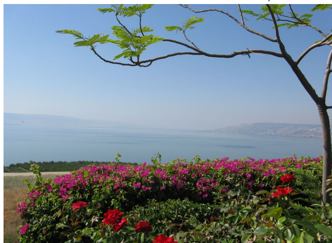
See Genezareth, Blick vom Berg der Seligpreisungen