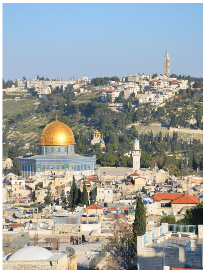
Jerusalem - Blick auf die Altstadt und Ölberg