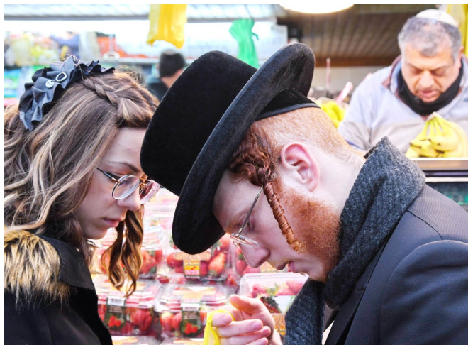
Auf dem Markt, Jerusalem