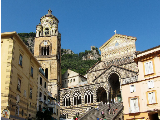
Dom von Amalfi

Mittwoch, 27.09.2023 – Mittwoch, 04.10.2023