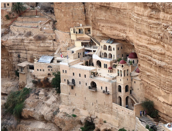
Georgskloster, Wadi Qelt

von Sonntag, 17.03.2024 bis Dienstag, 26.03.2024