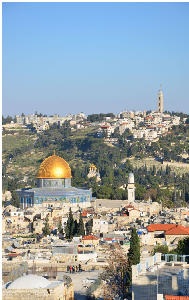
Blick auf den Felsendom und den Ölberg, Jerusalem